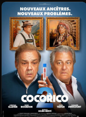
20h45 Cocorico 2