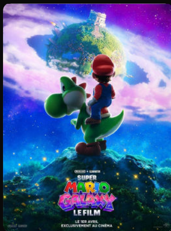
16h00 Super Mario Galaxy