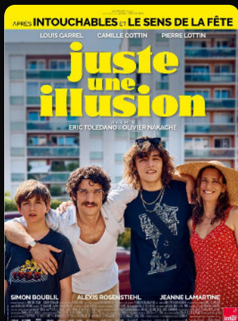
18h00 Juste une illusion